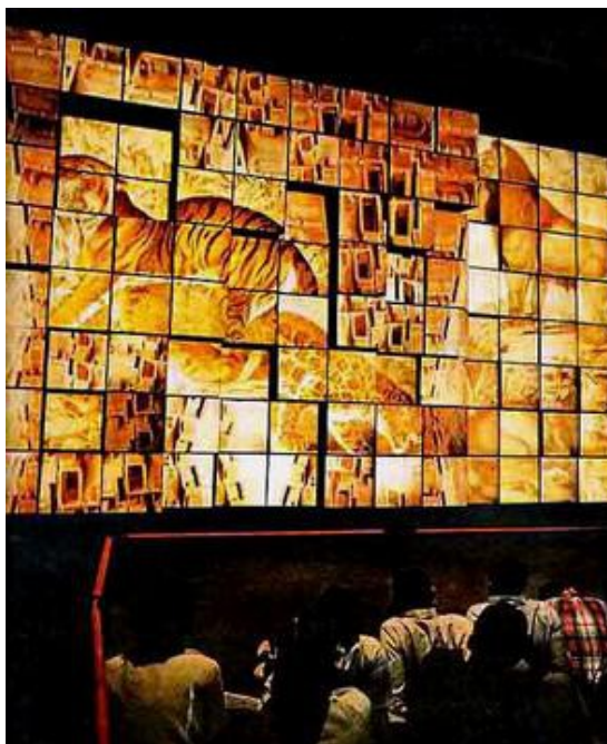
Figura : Polyecran, 1967. Exposição Internacional de Montreal.

A experiência Lanterna Magika (Expo 1958) consistia em oito telas de formatos quadrados e trapezoidais sobre um fundo preto. Utilizava-se de um tipo de tecnologia, que nos dias atuais não assustaria ninguém, mas que, para a sua época representou grande inovação em termos formais. Era uma proposta de espetáculo sincronizado de luz, som e vídeo em que inexistia o texto falado.