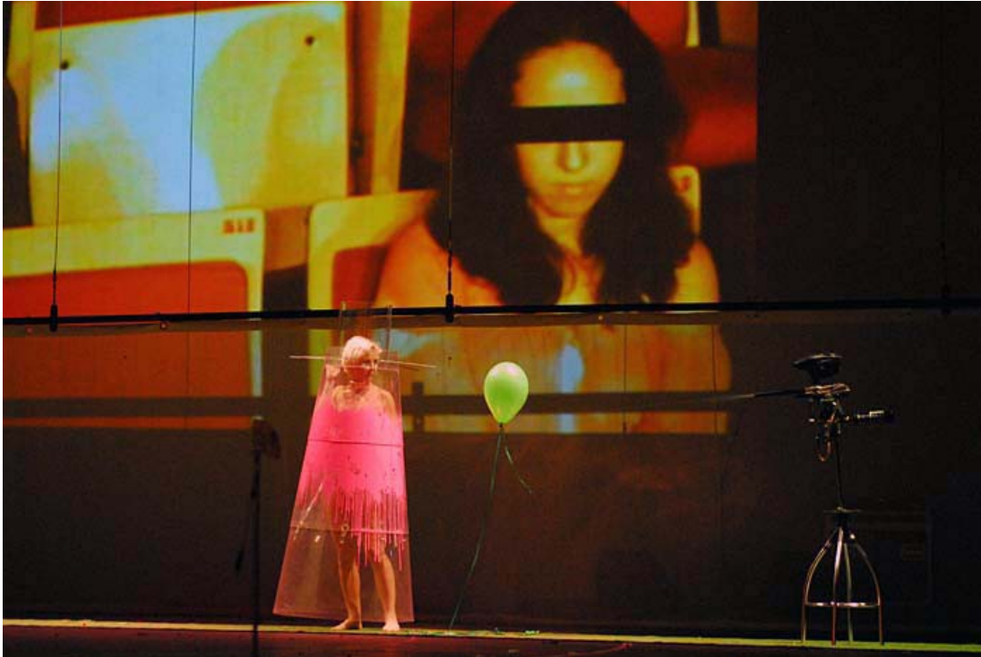
Figura 3: Cia. Cena 11 'Pequenas frestas de ficção sobre realidade insistente'.