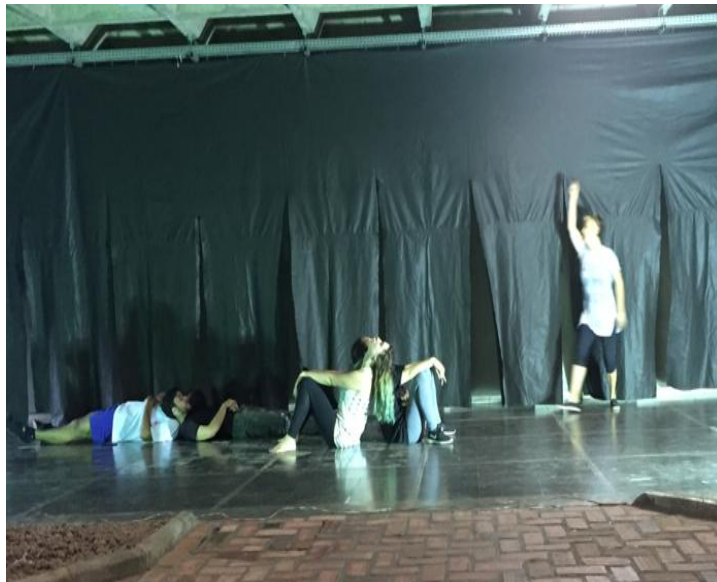
FIGURA 4: Apresentação da fase da pesquisa na Mostra de Dança da EEFFTO/UFMG em 29/11/2018.

O projeto está em andamento. Das intervenções previstas estivemos por enquanto apenas na casa de JK e na Casa do Baile. Desta fase da investigação, elaboramos um relatório de pesquisa em forma de espetáculo de dança apresentado na Mostra de Dança da EEFFTO/UFMG em 2018 apresentando o estágio das reflexões em dança.