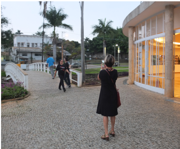
FIGURA 2: Casa do Baile na Pampulha

Na sequência fizemos um estudo na Casa do Baile, inaugurada em 1943, para abrigar um pequeno restaurante, um salão com mesas, pista de dança, cozinhas e toaletes, com a finalidade de criar uma valorização artística da Pampulha e como função social, a diversão para o povo. Acabou desativada em 1948 após o fechamento do casino da Pampulha 3 em 1946. A casa do baile se localiza em uma ilha artificial, acessada por uma ponte de onze metros. Destaca-se pelas formas da fachada e marquise sinuosa.