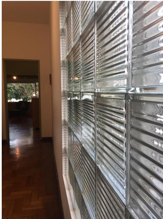
FIGURA 1: Interior da Casa de Juscelino Kubitschek.

Optamos por iniciar nossa pesquisa pela Casa Kubitschek que foi projetada para ser residência de fim de semana de Juscelino Kubitschek. A casa possui características da arquitetura moderna. Os jardins e o pomar são do paisagista Burle Max. No entanto, JK nunca habitou a casa, pois logo, como presidente do Brasil se mudou para o Rio de Janeiro e iniciou as obras de Brasília que viria a ser a nova capital do Brasil. Hoje o local, funciona como espaço cultural e museu que abriga objetos da época.