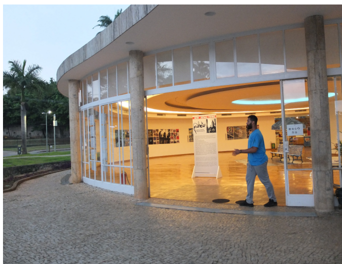
FIGURA 3: Casa do Baile da Pampulha

Partimos do princípio de que o corpo é um conjunto de estruturas que ocupa espaços através da presença e inserção desse mesmo corpo no cenário urbano, em específico, no conjunto arquitetônico da Pampulha. A dança nesse contexto, se materializa no dialogismo entre as formas e a estética ( aistesis ) dos espaços ocupados. Nesse contexto, as obras visitadas têm sido como convites aos estímulos sensoriais e espaciais.