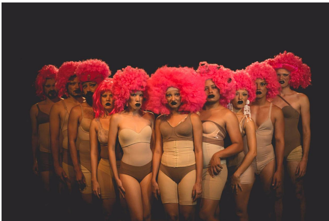
Espectáculo: I(MUNDO) UBU – Imundas de Teatro, 2017.

Os processos estão postados no blog a partir de registro que ao se conectar com o espaço virtual podem criar outra interpretação da obra, expondo um sentido que se liga com o não lugar da rede. Os trabalhos são visualizados a partir de conteúdos cartografados durante os processos de criação, mostrando uma memória e um corpo que se lança nessa hibridação constituída que pode ser analisada nessa alteração de significados.