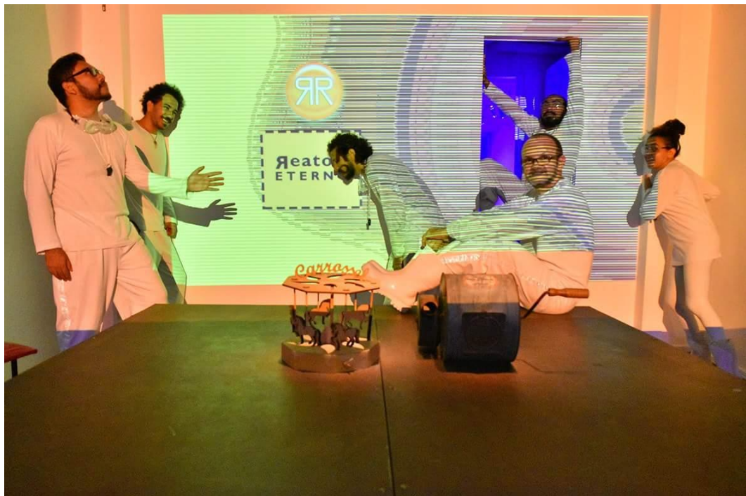
Projeto Reator Eterno – Estúdio Reator, 2016.