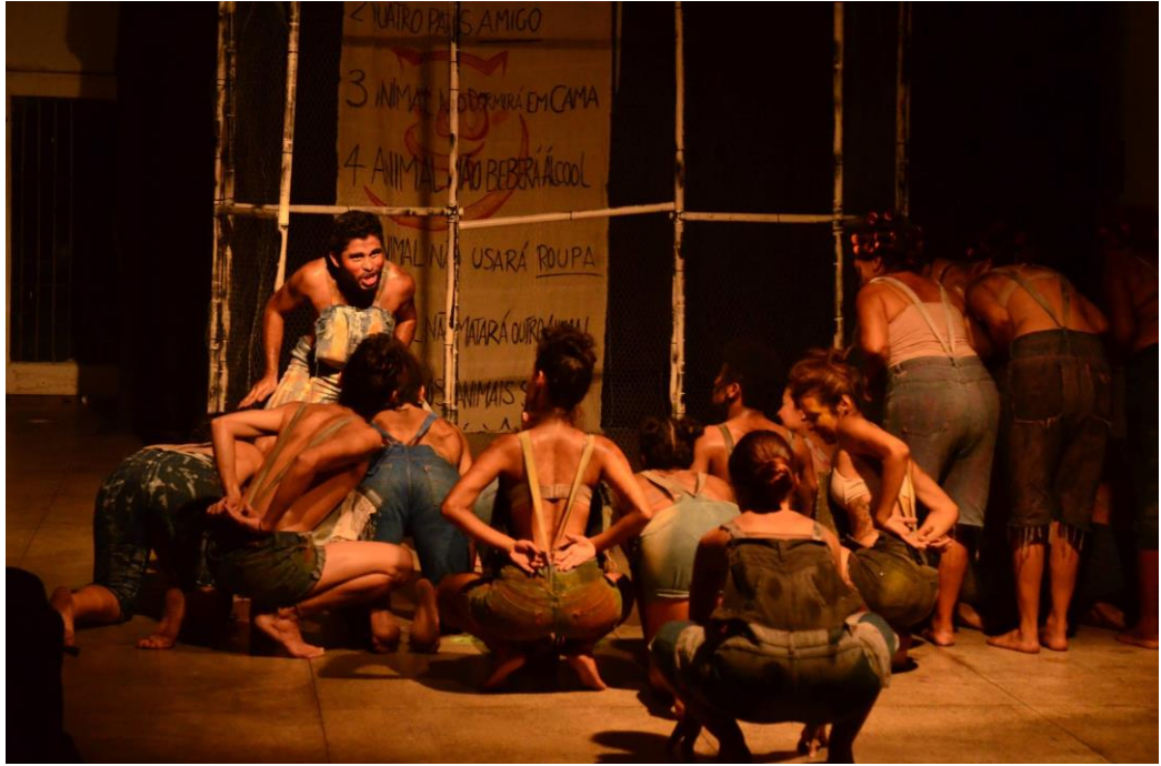
Espectáculo: Animalismo – A nova ordem mundial, 2015.