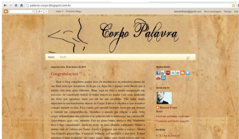
Blog Corpo Palavra . ( https://palavra-corpo.blogspot.com )

Diante dessa elaboração podemos escrever a leitura que surge da nossa interpretação, textualizar os enigmas do espaço vivenciado, se manter presente no vago/opaco dos meios que estabelece contato com o mundo e produzir uma contextualização. O pesquisador ao hipertextualizar a sua criação: amplia os sentidos que a sua produção manifesta, encontrando meios para outros diálogos que emergem em sua pesquisa onde flui um discurso a qual irá justificar cada parte da sua obra. Pierre Lévy fala sobre essa produção de pensamento diante da leitura de um texto e de uma criação de texto por meio da leitura, estruturando assim um conteúdo a ser informado. Nesse sentido, o hipertexto é uma corporação de um texto ao outro, uma via que se desenvolve em fragmentos pensativos do mundo; no âmbito virtual seria: rede de criação que reproduz o pensamento em textos e figuras para outra interpretação.