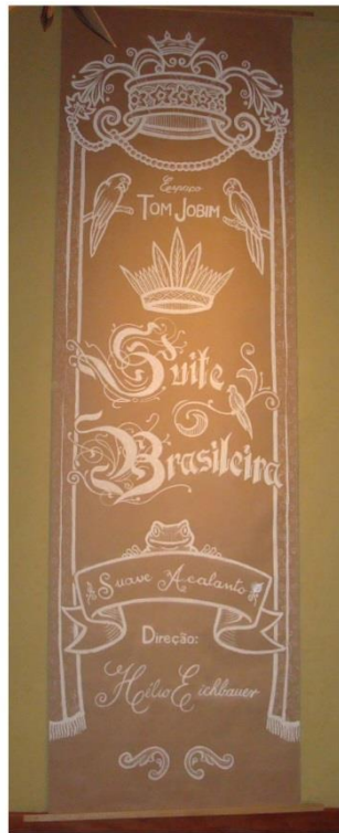
Fotografia de Regilan Deusamar – 18/05/2010.

Fig. 5 – Painel de apresentação da peça. Desenho de Antonio Fabio Vieira. Giz sobre papel kraft.