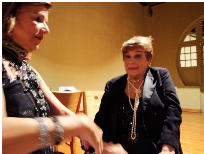
Fotografia de Mônica Costa – 18/05/2010

Também as pesquisas iconográficas realizadas pelos alunos e alunas ficaram expostas no hall do teatro, para que a plateia pudesse apreender os fundamentos iconográficos que foram analisados coletivamente. Através desses estudos alunos e alunas puderam compreender tanto um determinado processo de construção da imagem cenográfica quanto um processo de construção das personagens e as relações que conectam cenografia e indumentária. Portanto, este estudo realizado foi considerado tão didático e importante que foi decidido pelo professor, alunos e alunas que estes materiais deveriam ser expostos à plateia, que poderia se informar bem como apreciar aquelas imagens que inspiraram todo o processo de construção da cena teatral e ao mesmo tempo tratavam da história de artistas e obras brasileiras de finais do século XIX ao início do século XX, inclusive estudo a respeito de artistas negros e negras, os quais em vida foram alvo de discriminação racial, mas que nesta encenação tiveram suas realizações artísticas reconhecidas, muitas das quais desconhecidas pelo grande público, justamente pelos entraves que, mesmo após a abolição da escravatura, continuaram a martirizar as populações negras, ainda estigmatizadas pela herança do Brasil que se ergueu sobre o escravagismo.