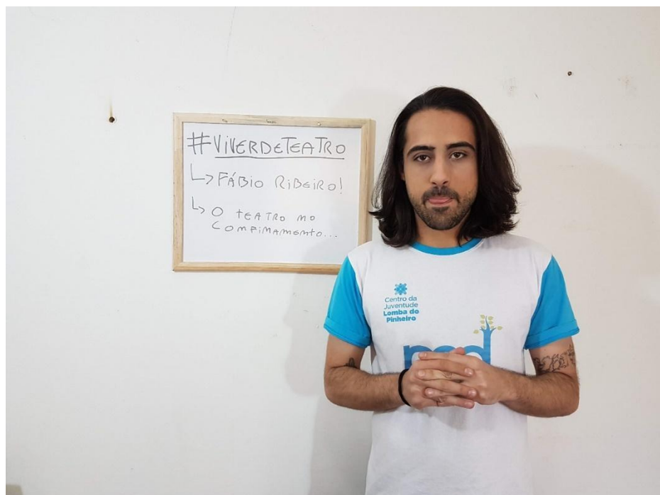
No quadro, um dos muitos momentos de 2020: as videoaulas criadas a partir de um mundo doente, de um momento doente. 20