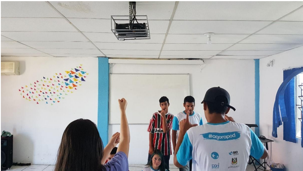
Montamos uma cobertura jornalística de um possível ataque terrorista no centro de Porto Alegre. 5