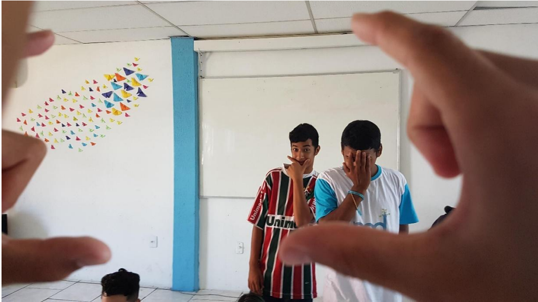
Registros do momento em que criamos cenas a partir de referências audiovisuais da vida de cada aluno. 4