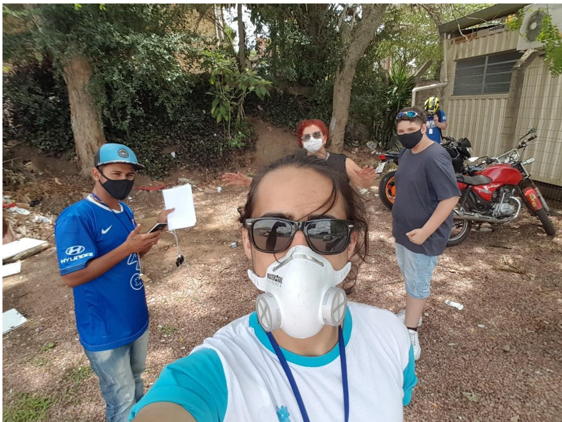
O nosso fumódromo: lugar de muitos encontros, muitas conversas, choros, risadas, medos, felicidades e fumaça. 31