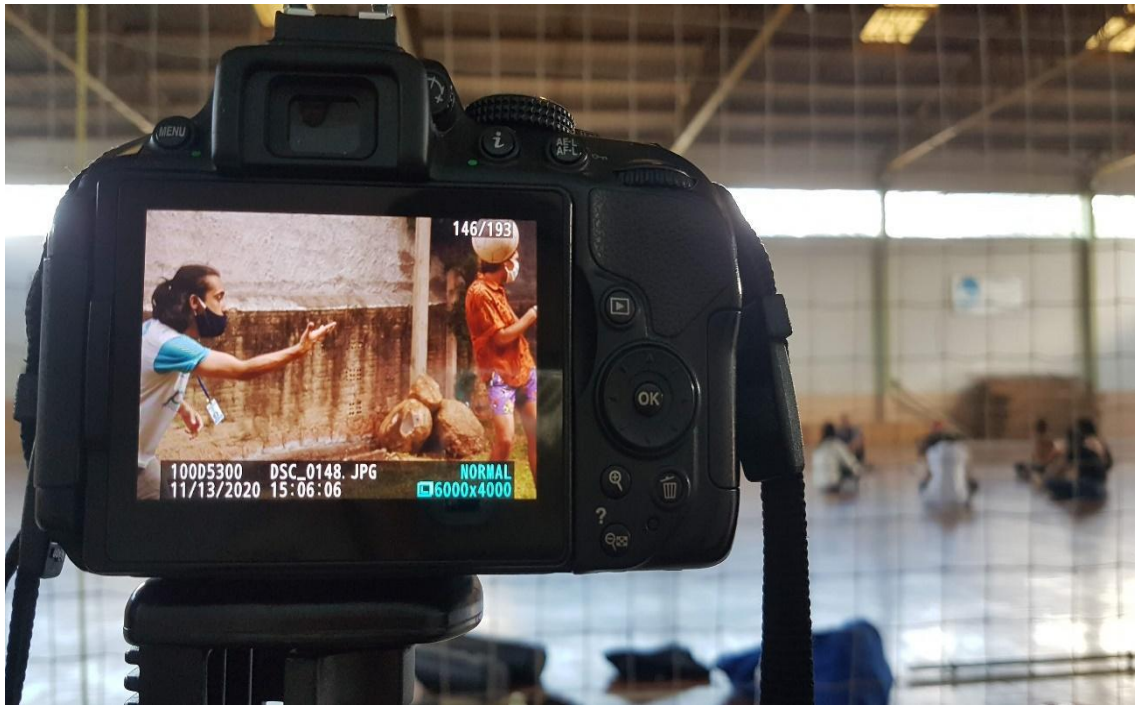
Ainda mais um registro de nossa atividade no workshop de capacitação do elenco de crianças e jovens “não atores” para o comercial. 30