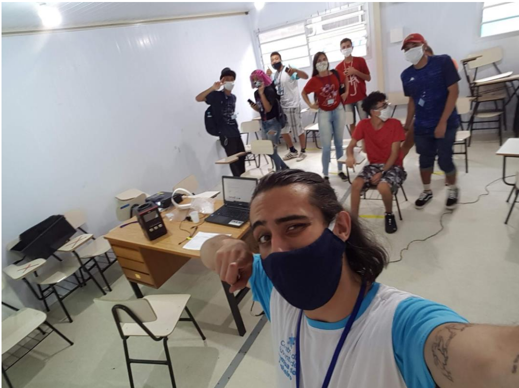
A aula de espanhol sempre funcionou no antigo e "calorento" módulo 58. Agora, o ar-condicionado está gelando e esquentando. A turma, propensa a estudar e aprender o idioma, logo gostou da possibilidade de experimentarmos o que víamos, ouvíamos e falávamos em castelhano na turma de teatro: temos aí a proposta para a realização na formatura 18/12, que vemos em "Corre que o Cônsul vem aí!". 29