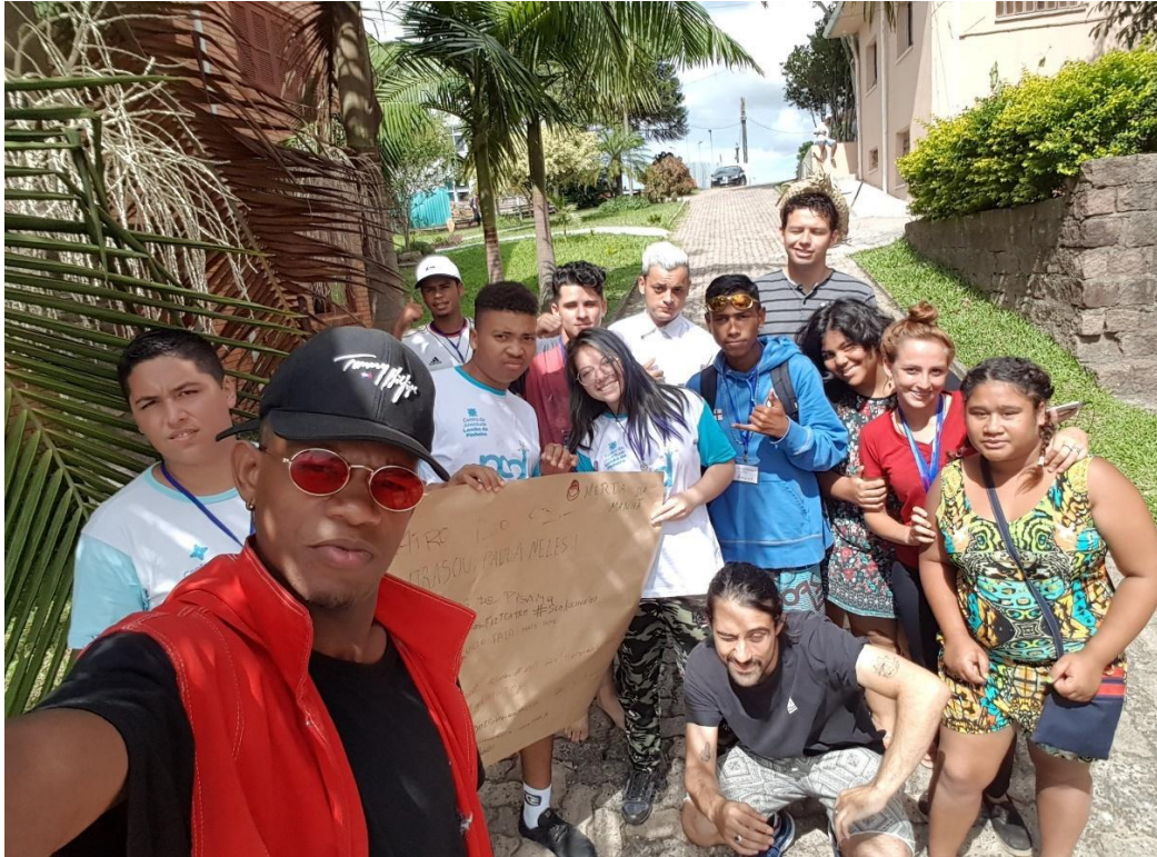
Aqui, já temos a saída de um dos grupos após esse momento, que foi realizado com as 4 turmas então presentes. 28