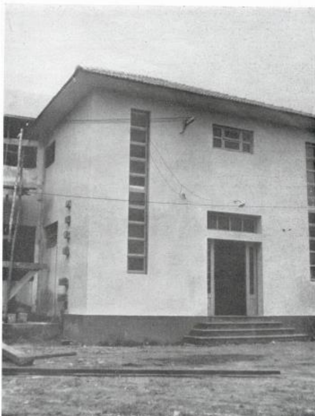
Figura 1: Entrada principal do Cineteatro Territorial de Macapá 3

O Cineteatro Territorial de Macapá teve sua construção iniciada logo no primeiro semestre de 1944, sendo inaugurado em julho do mesmo ano. Tinha como função principal servir de sede de despachos do governo, e ainda difusor político, educacional e cultural. Na figura 01, vê-se a fachada do Cineteatro Territorial, a entrada principal que dava acesso à rua Candido Mendes, e à esquerda do prédio a incorporação deste com a primeira escola em alvenaria de Macapá, o Grupo Escolar Barão do Rio Branco (figura 02), inaugurada em 1946.